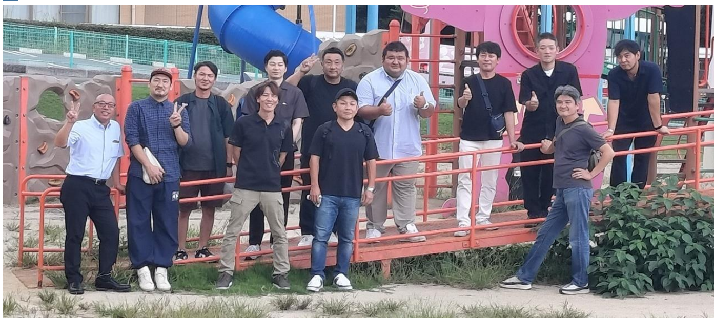
鉄輪地獄地帯公園 遊具視察